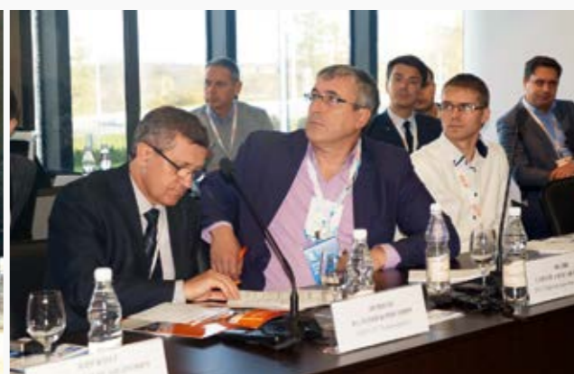
Участники Межотраслевой экспертной сессии