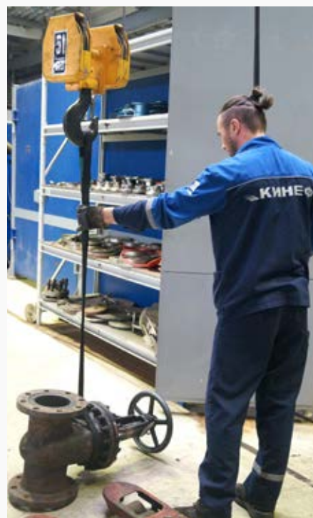
В ООО «КИНЕФ» эксплуатируется порядка 180 тысяч единиц трубопроводной арматуры

«Зная, что у нас в Ленинградской области находится большая нефтеперерабатывающий завод – единственный на Северо-Западе, я не мог упустить возможности там побывать, – сказал гендиректор