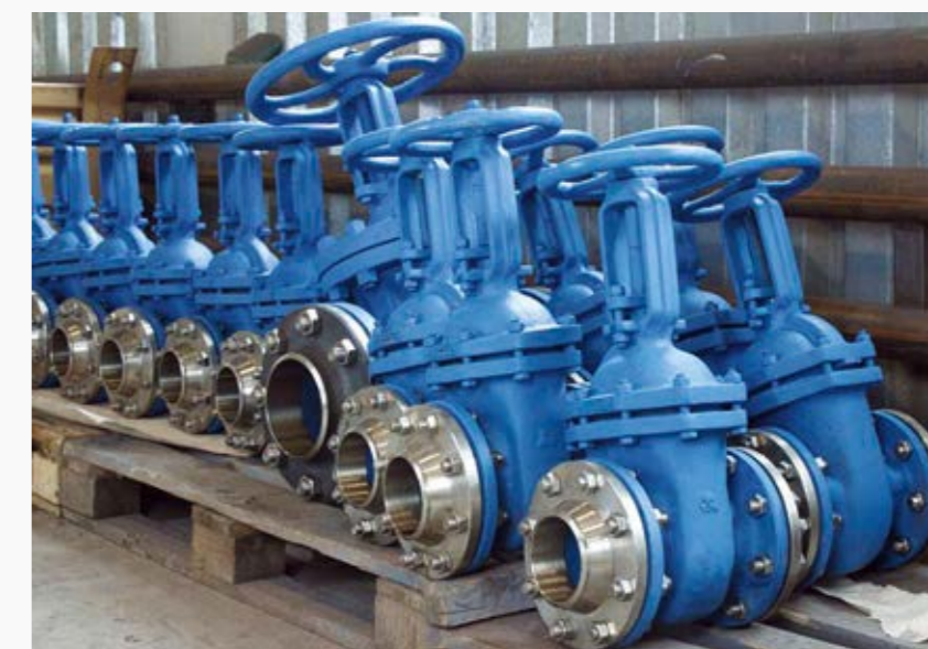
Георгиевский арматурный завод уже поставлял в ООО «КИНЕФ» пробные партии арматуры, и нареканий по поводу качества не было

ООО «КИНЕФ», который в рамках рабочей поездки неоднократно посещал Владимир Владимирович