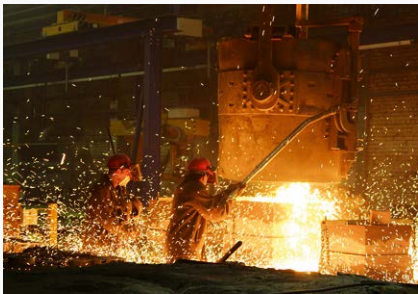
В настоящее время ГЕАЗ стремится к тому, чтобы уровень производства соответствовал современным технологическим процессам

Сегодня Георгиевский арматурный завод производит широкий ассортимент продукции: задвижки клиновые, клапаны предохранительные, устройства переключающие, блоки предохранительных клапанов с переключающими устройствами, клапаны запорные (вентили), клапаны обратные подъёмные, затворы обратные. Имеются мощности для выпуска специальной арматуры (для подземной установки, криогенной и аммиачной). В стадии разработки – фонтанная арматура. Есть на предприятии и собственный сталелитейный цех, благодаря которому оно обеспечивает себя высококачественным литьём.