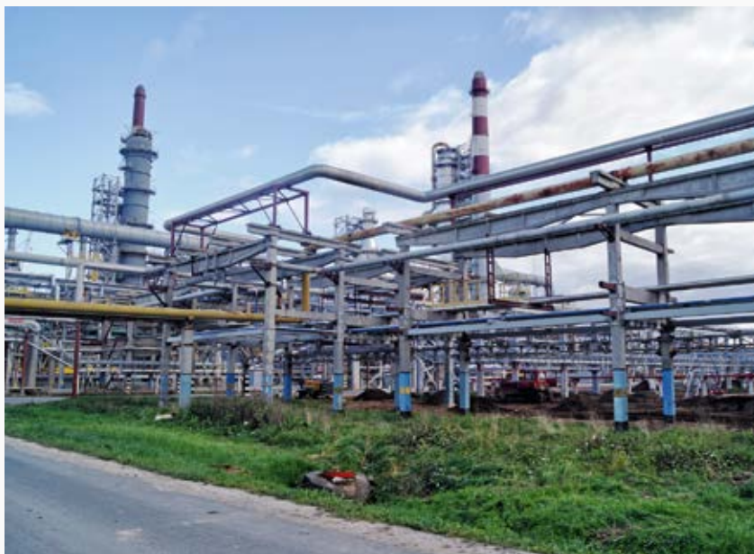
Производство ООО «КИНЕФ» (г. Кириши) поражает своей масштабностью