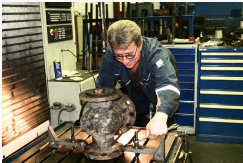
Для каждого города завод имеет огромное значение. Ведь это рабочие места, это чьи-то людские судьбы