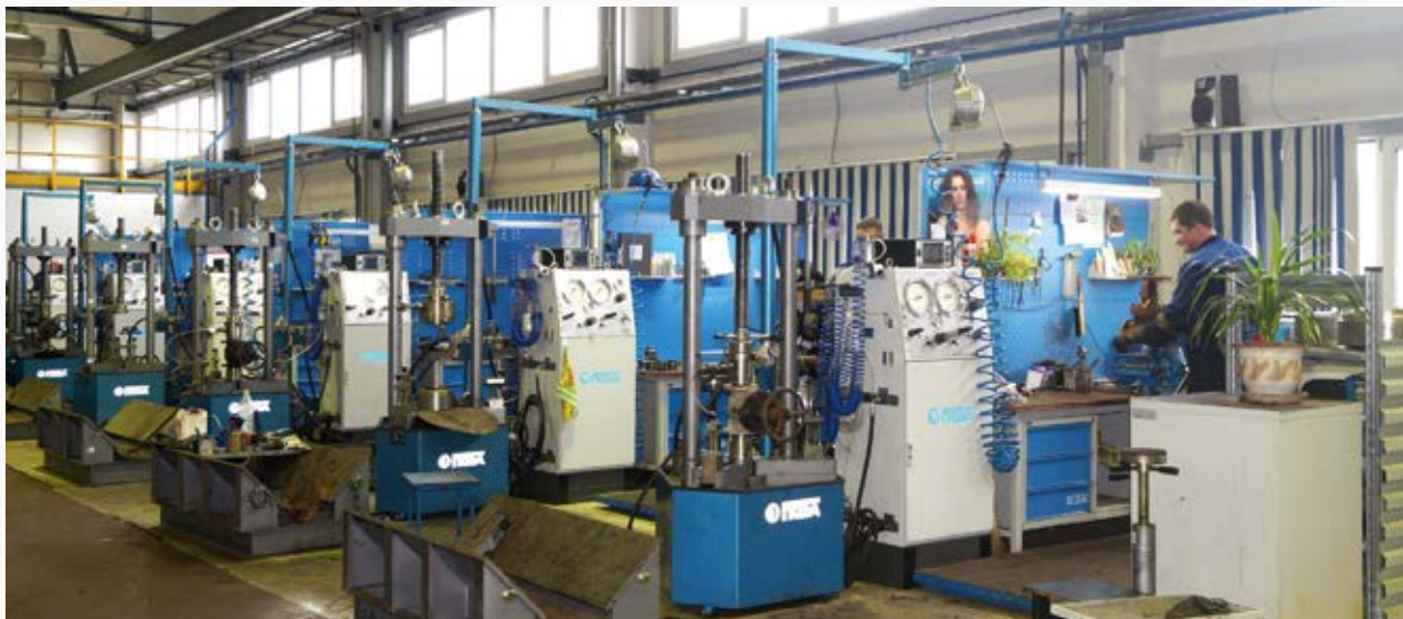
Испытательное оборудование на участках по ремонту запорной и предохранительной арматуры цеха № 25 ООО «КИНЕФ»

Переговоры, проходившие в неформальной обстановке, оказались очень конструктивными: участникам удалось не только поделиться проблемами, но и найти точки соприкосновения для дальнейшей плодотворной работы, наметить перспективные планы.